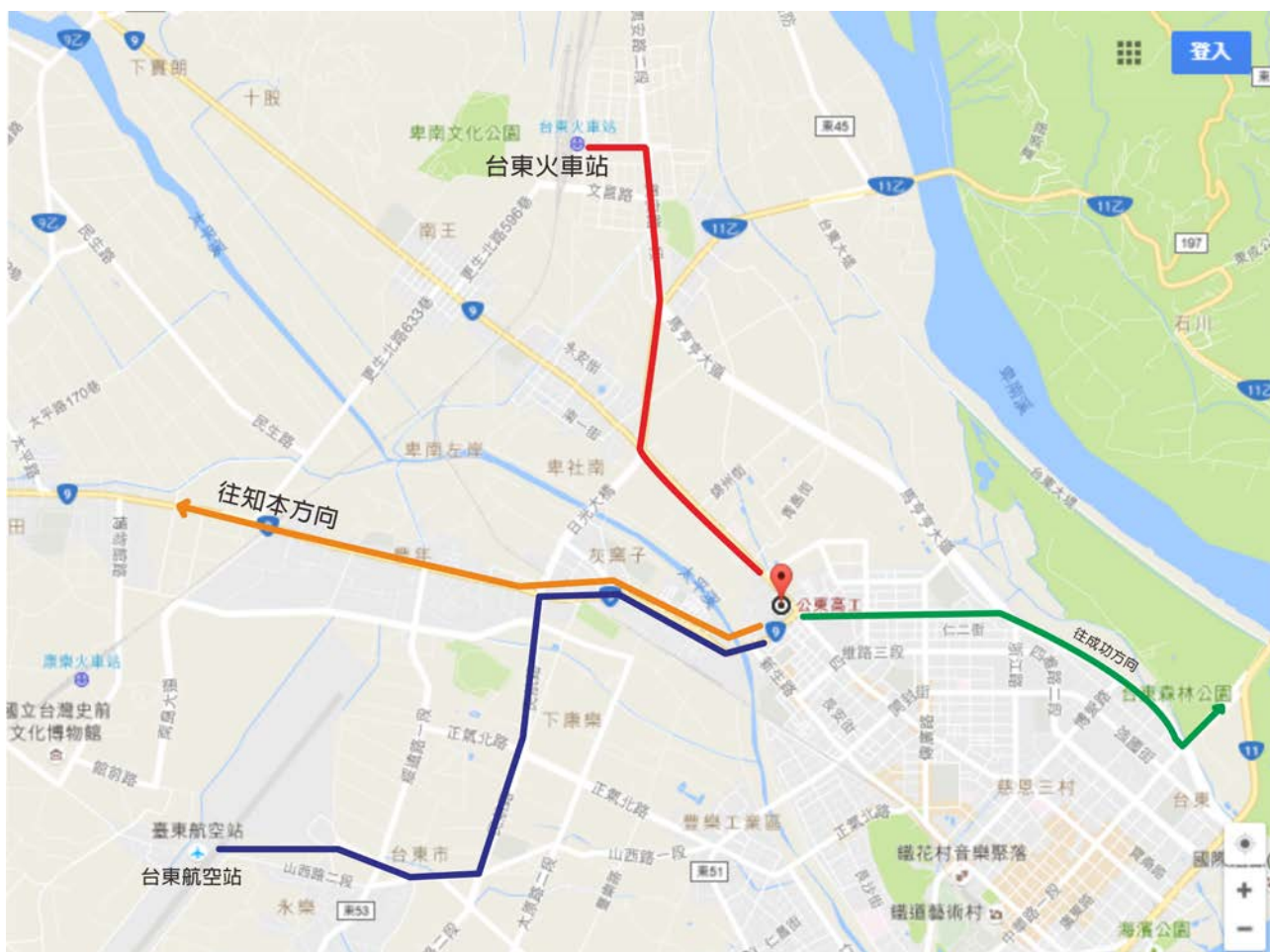
附圖一 承辦學校位置圖