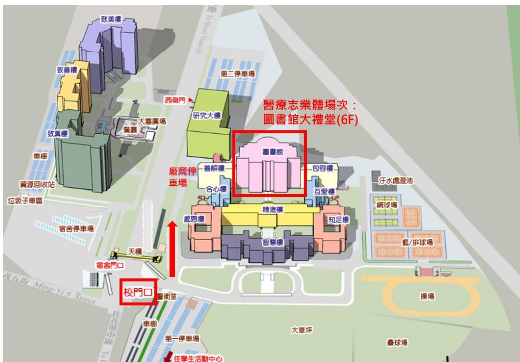
113年5月1日(三) 慈濟醫療志業體場次活動場地圖