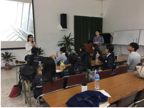
老師為我們介紹亞泥