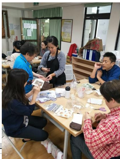
(老師協助學員製作)