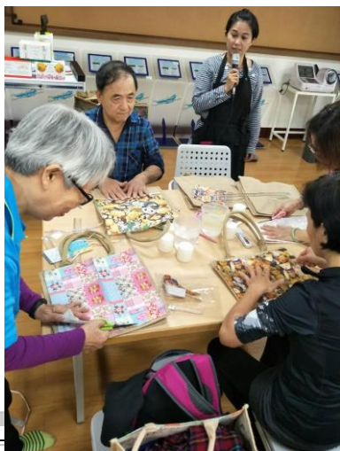
(老師說明步驟方法)